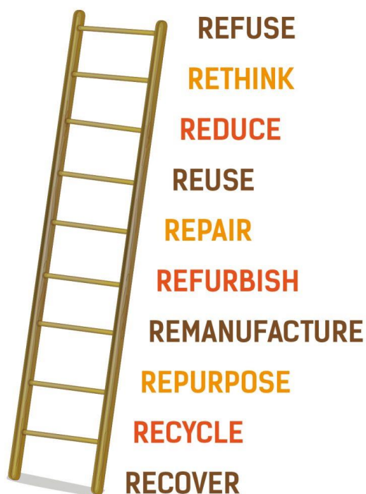
De "R" ladder